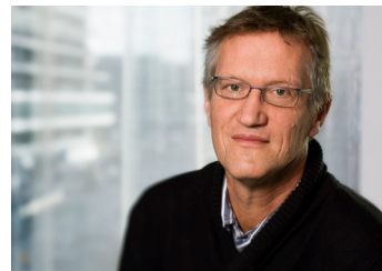
Anders Tegnell Folkhälsomyndigheten

Folkhälsomyndighetens statsepidemiolog Anders Tegnell, som syns i medierna oavbrutet i ett par veckor, förklarade att nu var tiden inne för stockholmarna att jobba hemma i den mån det gick. Hotell- och restaurangfacket hade räknat in varsel om uppsägning av 6 000 anställda och väntade på varsel om ytterligare 4 000.