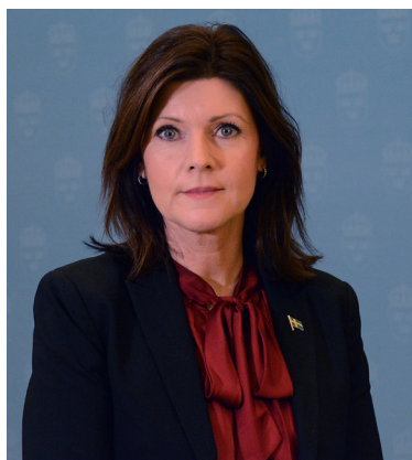
Eva Nordmark Arbetsmarknadsminister

Principöverenskommelsen kunde nu lämnas vidare till politiken för att förädlas till ett lagförslag. Flera frågor måste få en lösning, inte bara från politiken. Hur skulle parterna till exempel hantera att IF Metall och Kommunal inte ägde avtalet med omställningsorganisationen TRR. Det gjorde LO. Och hur skulle den politiska processen gå till och vem skulle ha inflytande över den? I TV lovade arbetsmarknadsminister Eva Nordmark svar på den frågan före jul. I januari kom beskedet att tre utredningar skulle tillsättas med kort tid på sig. Redan i maj skulle de redovisa sina resultat. I utredningarna skulle representanter för IF Metall och Kommunal ingå liksom LO-TCO Rättsskydds tidigare chef Dan Holke.